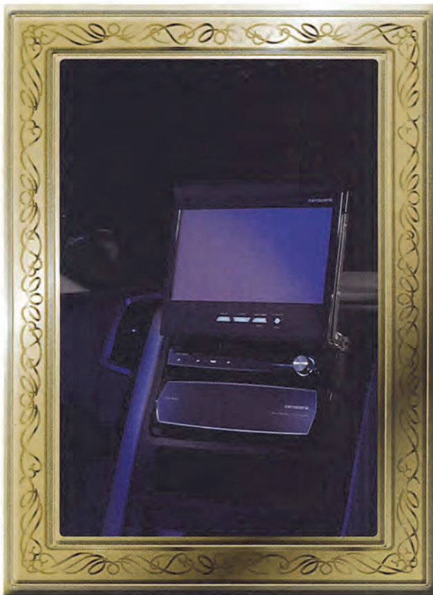
◎パイオニア ■0120-944-111 carrozzeria.jp